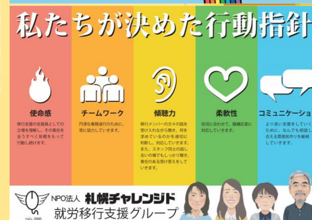
ワークショップの様子と、実際に作成された行動指針パネルの例です。