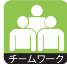
組織の目標達成、円滑な業務遂行のために、メンバーと協力し合う。