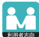
利用者の立場に立つて物事を考え、行動する。